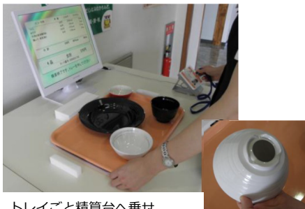
トレイごと精算台へ乗せ、社員証で精算