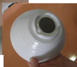
タグを取り付けた食器